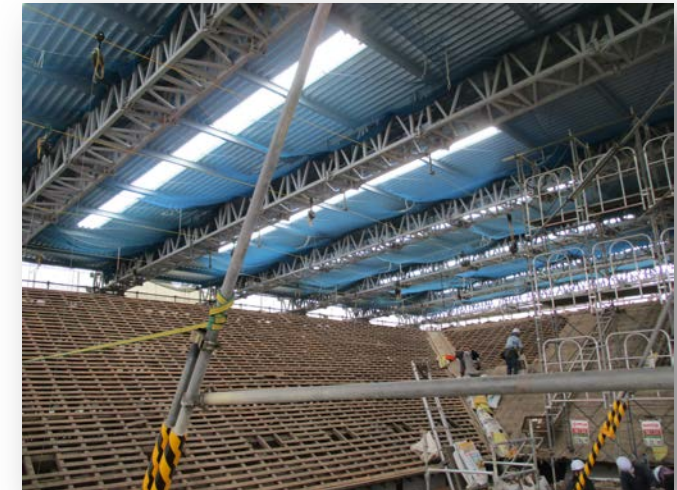
(瓦が撤去された状態)